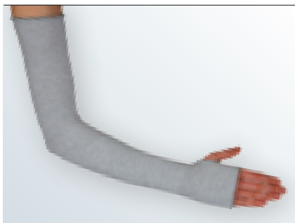
circaid undersleeve arm silver